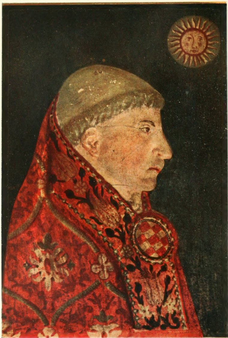
EL CARDENAL XIMENEZ DE CISNEROS